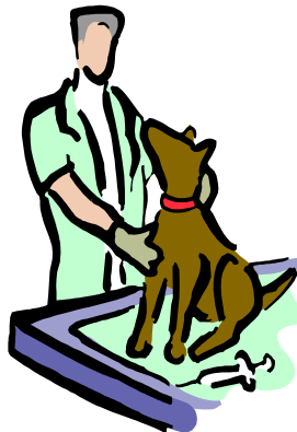
じゅう医さんに定期的に連れていくことが大事です！

どなんでも食べますが、それによって肥満になったり、歯がだめになったりすることもあります。このような簡単なステップに従えば、犬はけんこうで幸せに暮らすことができます。犬はあなたの助けを必要としていることを忘れないでください！